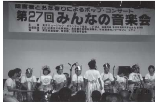
新宿セブンシティホールにて、「南の国のハメハメ八大王」「あしたもともだち」を元気いっぱい合唱、演奏しました。