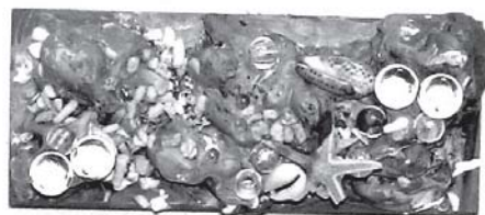
ミユちゃんの 入選作品

このコンクールは、『かまぼこ板をキャンバスに自由に個性あふれる世界を広げてみませんか』というテーマのもと、これまでに1歳から100歳まで幅広い人たちが参