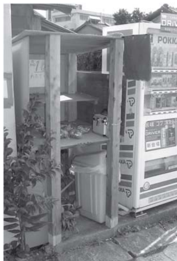
つくしんぼの敷地の角に 自動販売機と並んで建っています

商品の野菜は、ビニール袋に詰めて、全品100円均一。ダイソーではないので、品物の数も種類も少ないのがタマにキズ。ただ、とりたてばかりなので新鮮!! 売っている野菜の種類もその日によって違います。いや、なんにも売らない日も結構あったりして……。(^_^;