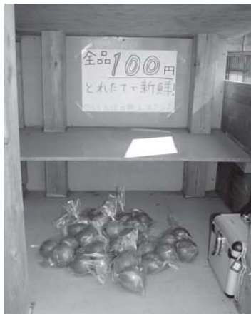
本日の品物は完熟トマト 見事に完売となりました

売っている野菜は、ナスにトマト、キュウリにインゲン。木の枝になっていたビワを、鳥に食べられてばかりではもったいないとばかりに、ハシゴに登って取って売ったこともありました。