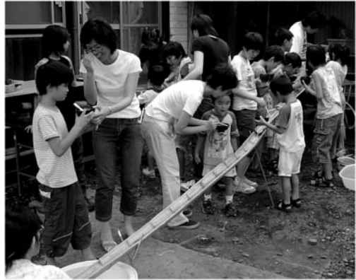
恒例 流しそうめん大会

学校のある日の活動より、夏休み期間は毎日の参加人数が増える傾向にあります。となると、毎年頭を悩ますのが、日々のスタッフ不足。今年は、人手不足でボランティア捜しに四苦八苦するよりはと早い頃からアルバイトを募集した結果、おかげさまで全活動日にスタッフを増員