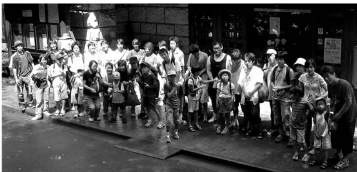
大地沢本館前にて

私がつくしんぼと出会ったのは、おとし の4月でした。つくつくっ子たちの最初 の印象は、とにかく「みんな自由だな~」 ということです。つくしんぼの建物や庭