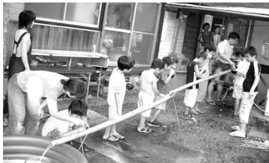
恒例 流しそうめん

親はもちろんそうですが、つくしんぼの職員もまた「ふ～、やっと終わってくれたあ…」という同じ思いに浸っ