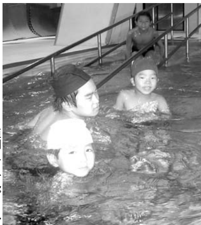
恒例 すみれプール