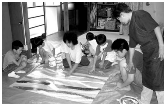
砂を使って 海の絵を描く

ともあれ、事故もなく、無事に終わった夏休み。あとは夏バテ状態から如何にして回復するかのように……。