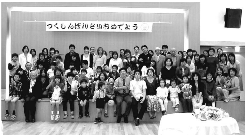
9/30 記念パーティーにて

「つくしんぼホームページ」アドレスは http://www.normanet.ne.jp/~tsukushi/ です