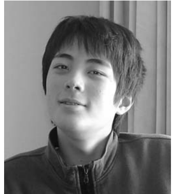
十五年間、ありがとう。ほくのこと、忘れないでね。

しばらくして私は、公民館主催の町田市障がい者青年学級にスタッフとして参加し、さらに町田作業所連絡会の方たちと出会うことで、いつしか福祉の世界を知るようになってきました。親という立場だけでは知ることの出来ないであろう、いろいろなことを経験をさせて貰いました。