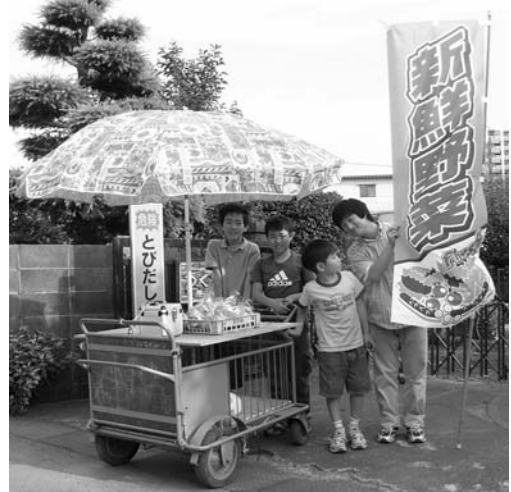
散歩しながら野菜販売も

そんな暑さの中でもつくしんぼの子ども達は、不思議なくらいに毎日元気につくしんぼで遊んでいました。