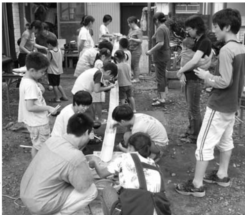
流しそうめんの風景

雲行きも怪しく、微妙な天気でしたが、流しそうめんをやりたいというみんなの願いが届いたのか、無事開催するこ