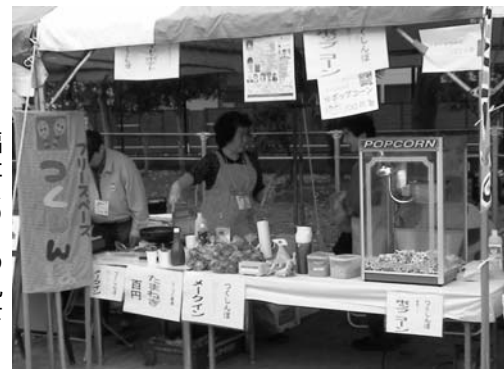
福祉まつりの風景

柿ワインをつくっているところもあるので、つくしんぼでもつくってみたいところですが、さすがに地ワインをつくるだけのノウハウはありません。あ、数ヶ月前につくった梅酒は飲み頃になってます。もちろん子どもたちは飲みません。(^^;