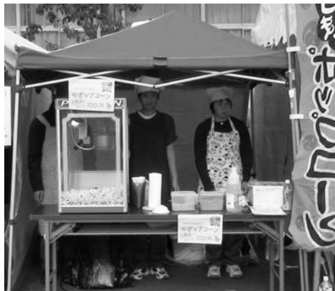
つくし野中フェスタの風景

て、トレイなどの販売がメインなのですが、その隅っこにさり気なく置いておいた柿入りクッキーがなんとまあ一番人気。初日も二日目もアツという間に売り切れてしまう始末……。